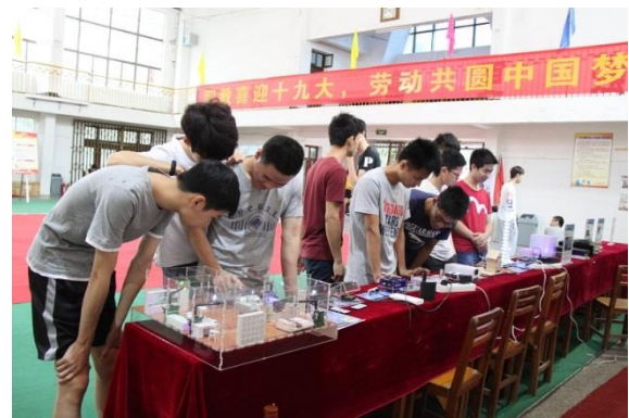
学生参观优秀作品