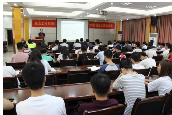
大学生创新创业选拔赛现场