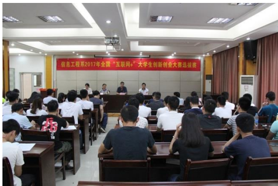
宁武新主任讲话“互联网+”

此次选拔赛得到了学院和系部的重视，我系将再接再厉，把培养具有“四创”的优秀人才作为己任，加强创新创业教育，提高教育水平，为社会发展输送更多人才。