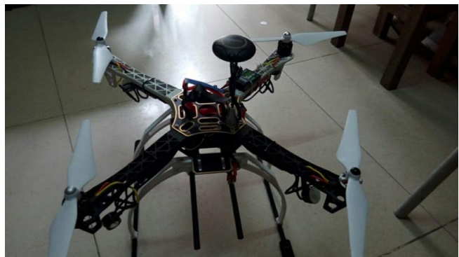
我系参赛作品——多旋翼无人机