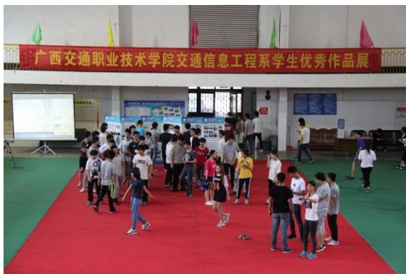
学生优秀作品展现场

5月11日在园湖校区风雨球馆开展信息工程系学生优秀作品展、观摩历年学生参加各级各类职业技能竞赛作品、荣誉榜等,充分展示校园文化,让师生了解职业教育,培养职业兴趣和职业意识,提高职业教育认可度,扩大职业教育的影响力。